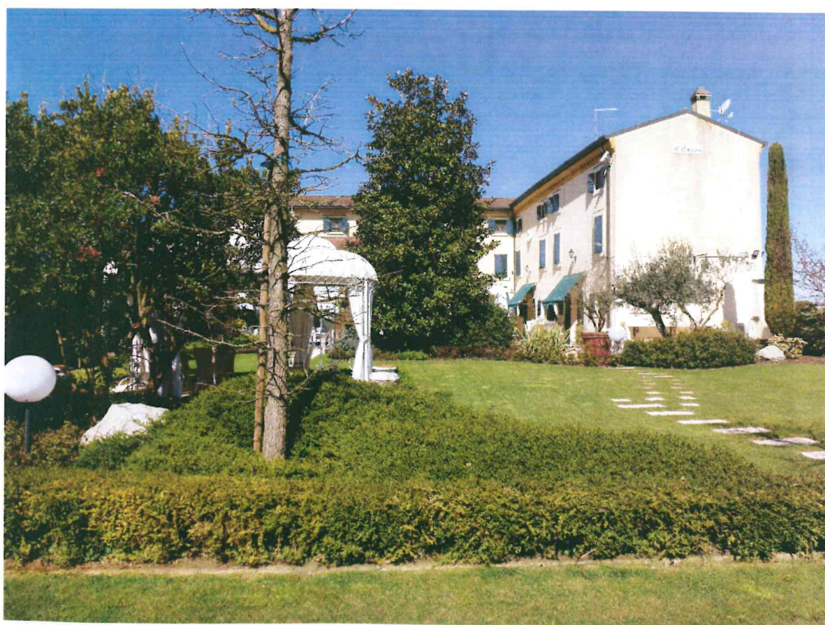
VISTA -4- DALLA CORTE INTERNA : DA SUD-EST