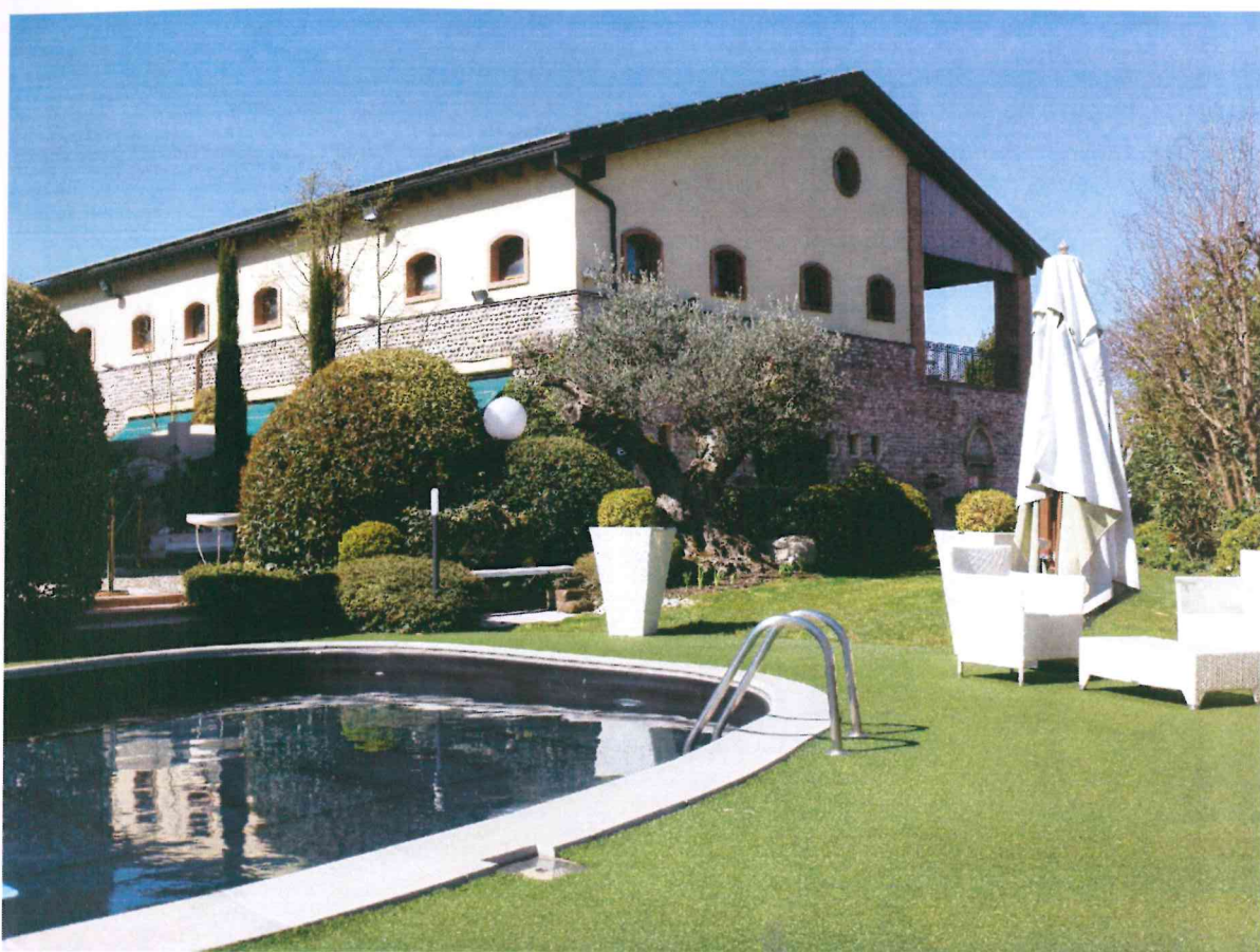
VISTA -3- DALLA PISCINA : DA NORD-EST