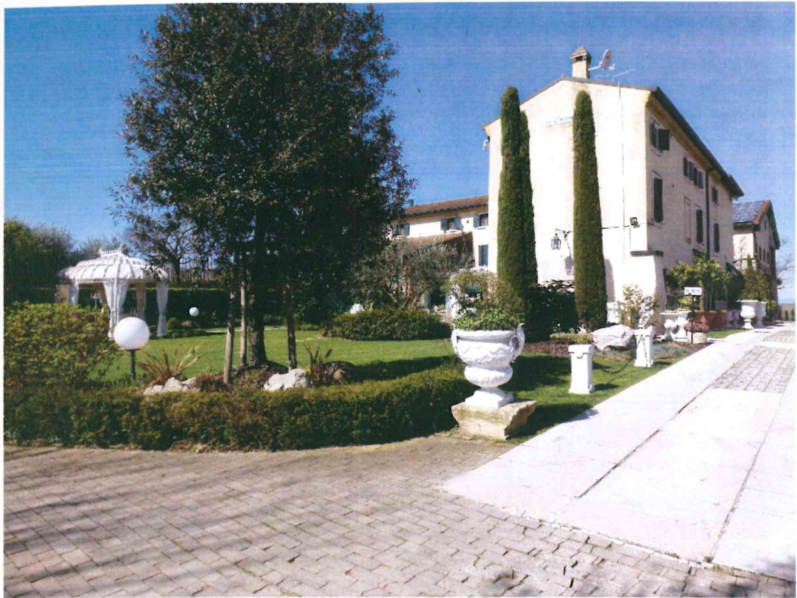
VISTA -5- DAL LATO ANTERIORE : DA SUD-EST