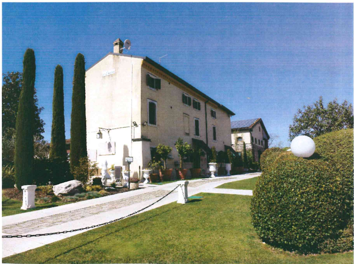
VISTA -2- DAL LATO ANTERIORE : DA SUD-EST