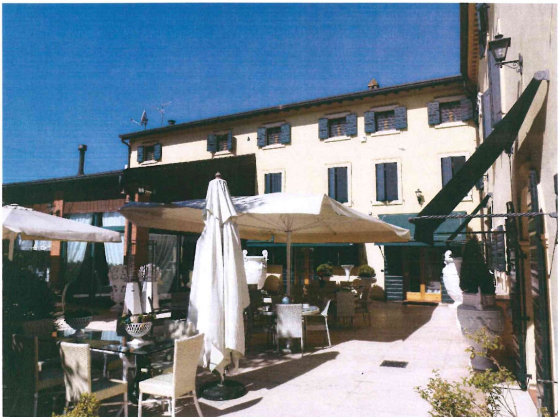
VISTA -6- DALLA CORTE INTERNA : DA SUD-EST