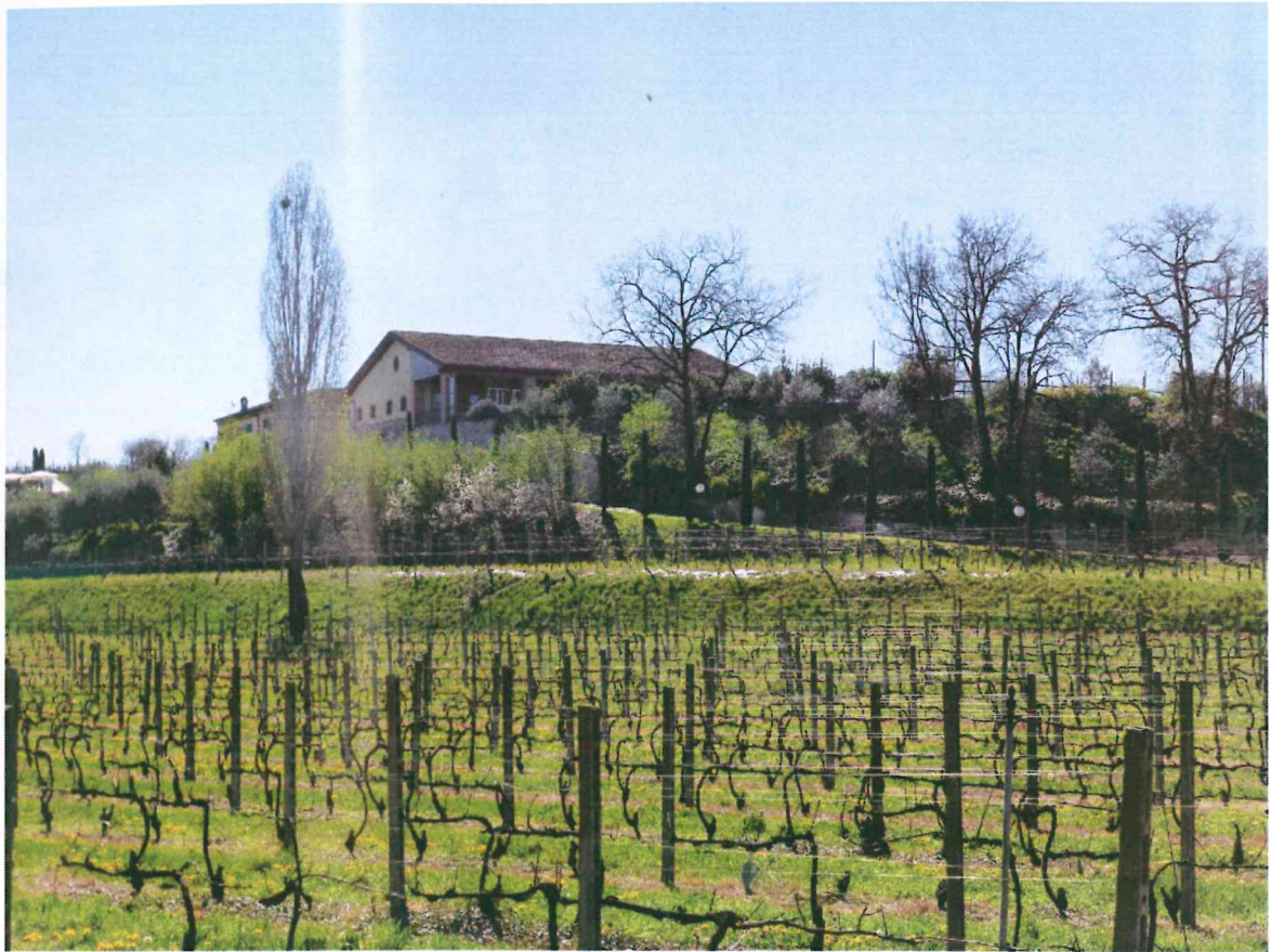
VISTA -1- DA VIA OSSARIO : DA NORD-OVEST