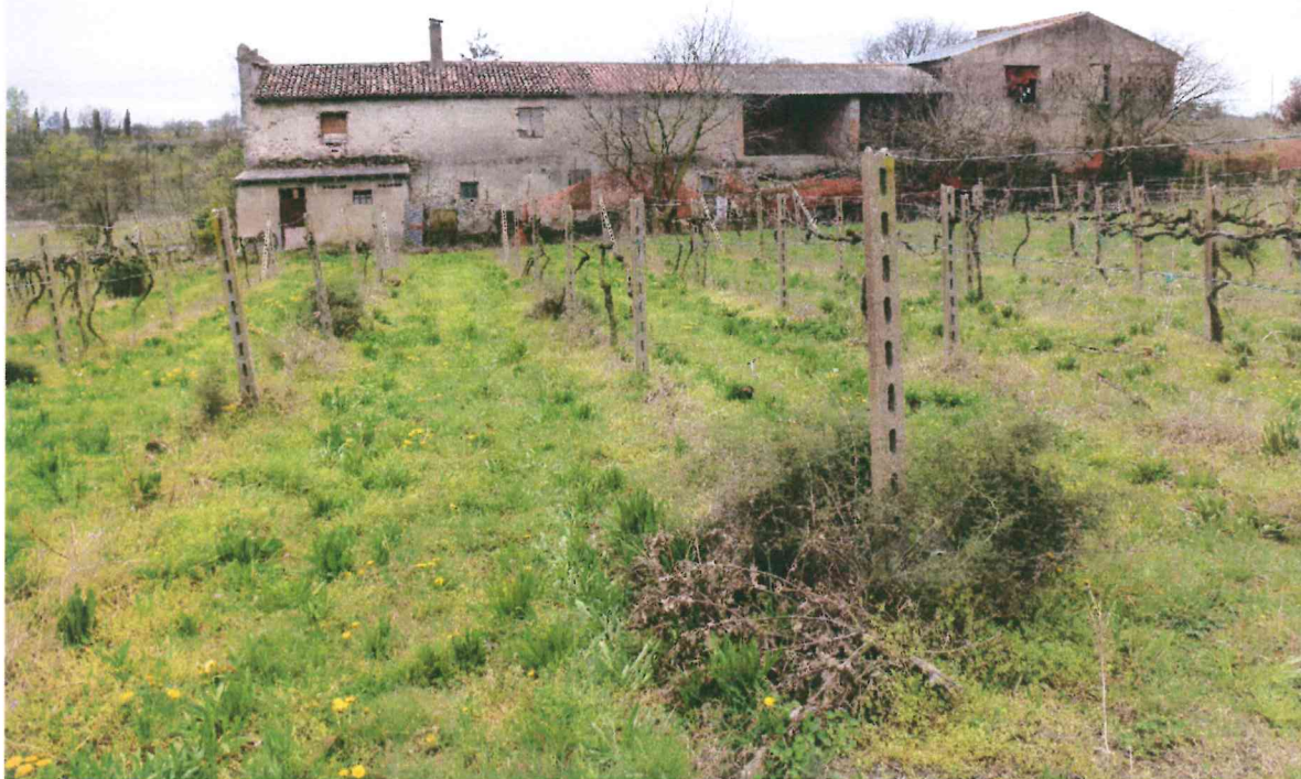
VISTA -5- LATO POSTERIORE : DA NORD