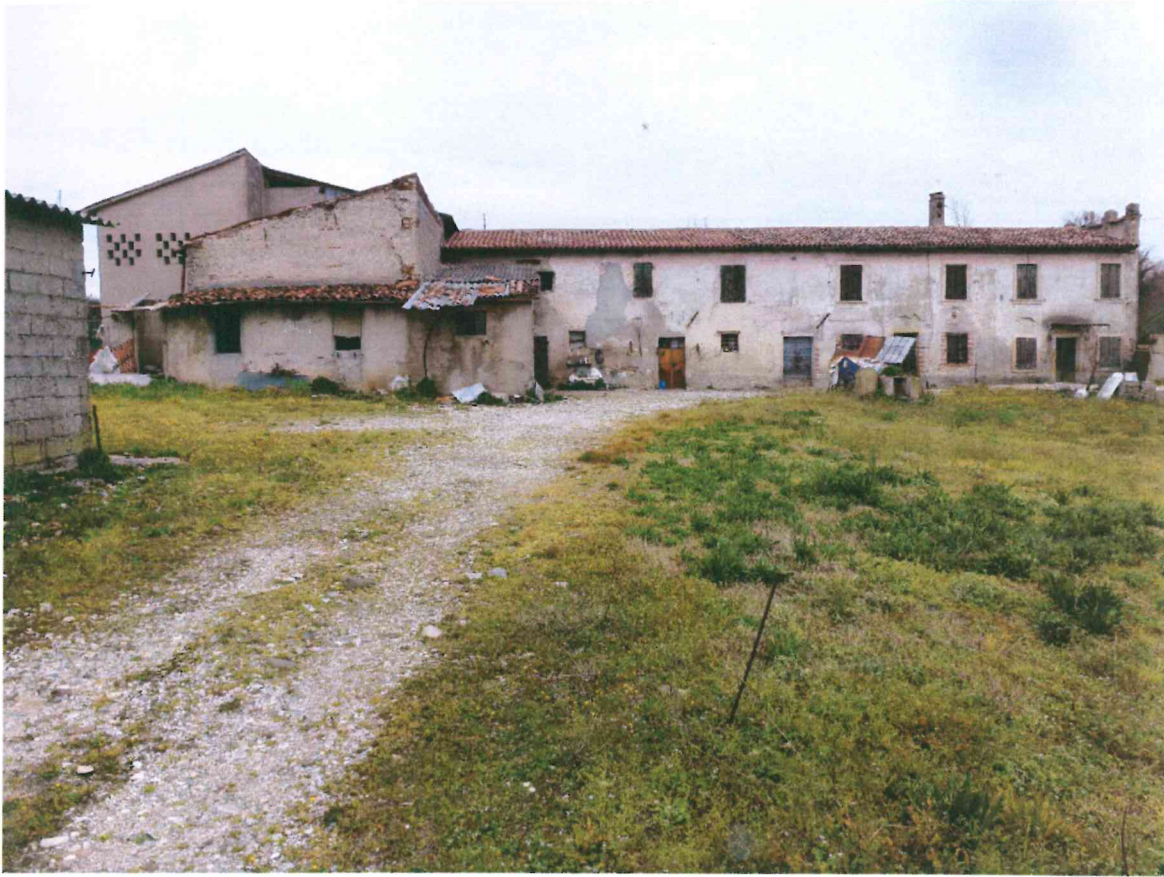
VISTA -3- DALLA CORTE INTERNA LATO ANTERIORE : DA SUD