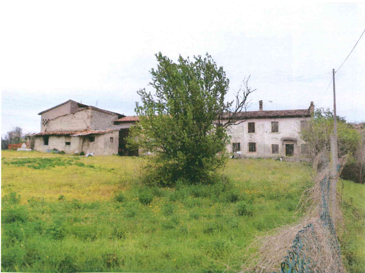
VISTA -2- DA VIA STAFFALO : DA SUD-EST (2)