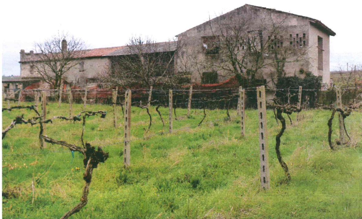
VISTA -6- LATO POSTERIORE : DA NORD-OVEST