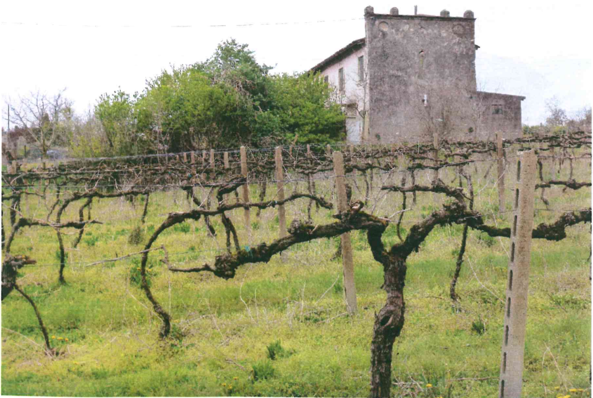
VISTA -4- LATO LATERALE : DA EST