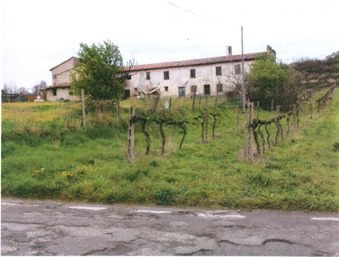
VISTA -1- DA VIA STAFFALO : DA SUD-EST (1)