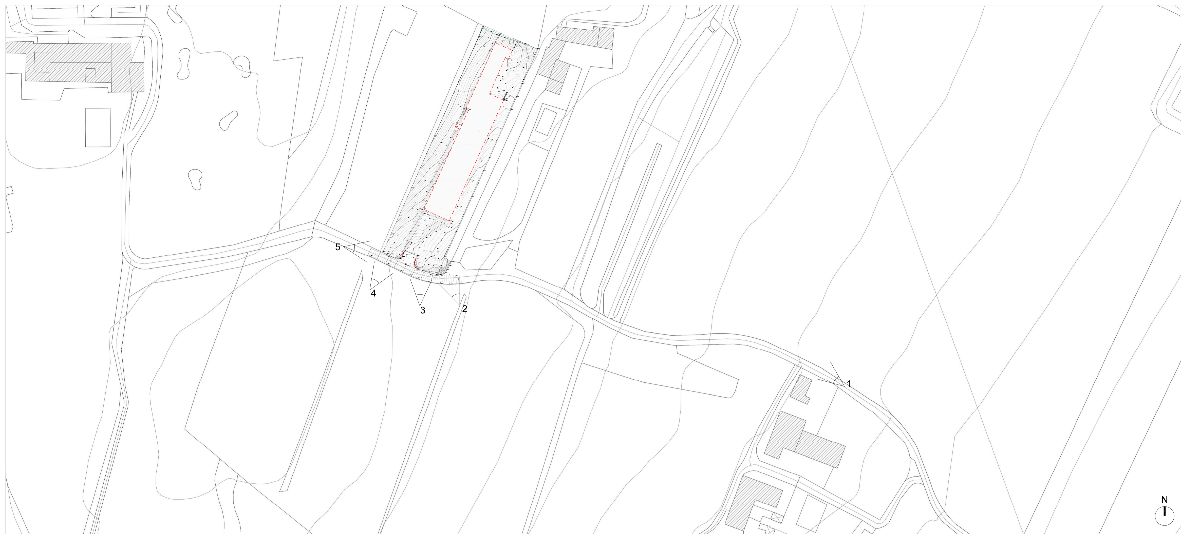
RILIEVO TOPOGRAFICO SU C.T.R. scala 1:1000

STUDIO ASSOCIATO Ing. GIOVANNI MONTRESOR - Arch. AMEDEO MARGOTTO Via Fama 11 - VERONA - Tel 0458012652 - e-mail: momaass@momaassociati.it