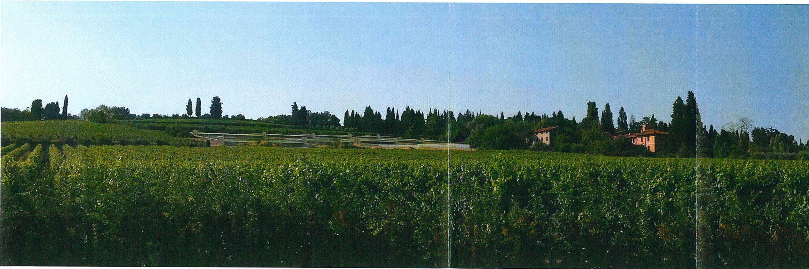
Allegato E. Vista della collina da Via Villanova (progetto) con l'inserimento di edifici ecologici ad impatto zero.