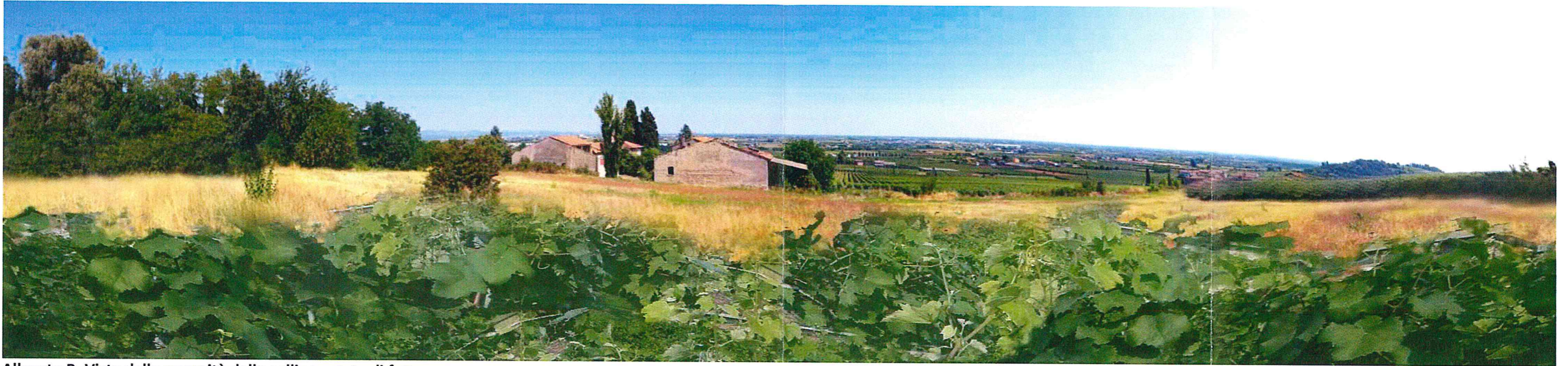
Allegato B. Vista dalla sommità della collina - stato di fatto.