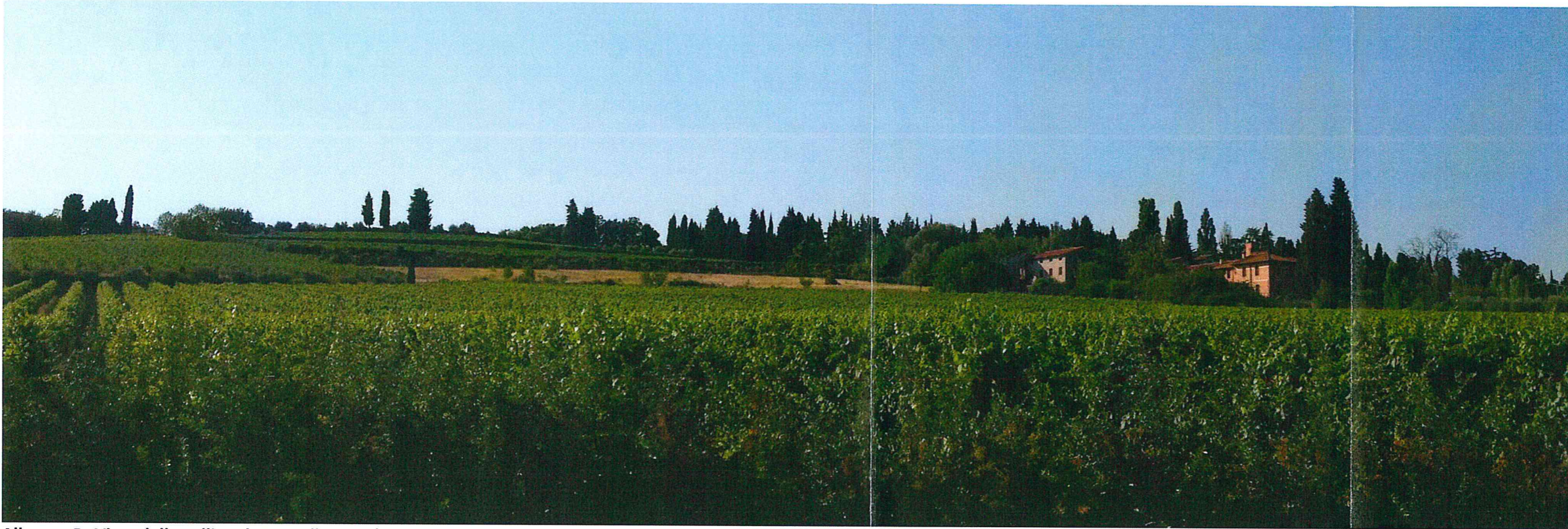
Allegato D. Vista della collina da Via Villanova (stato di fatto).