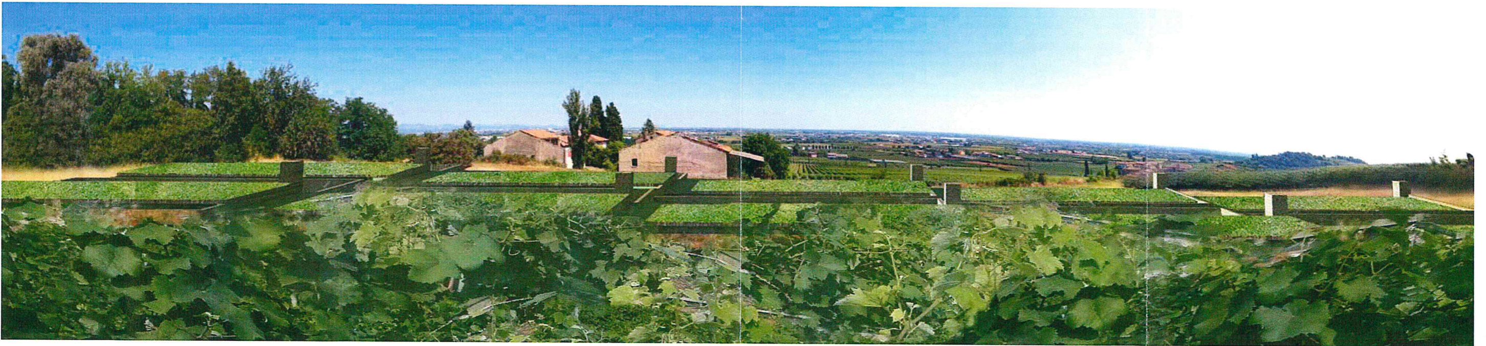
Allegato C. Vista dalla sommità della collina - stato di progetto.